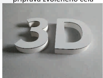
příprava zvoleného čela