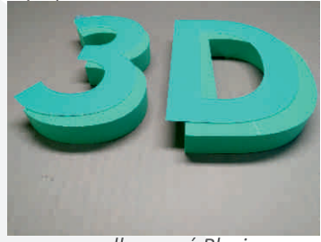
příprava zvoleného čela