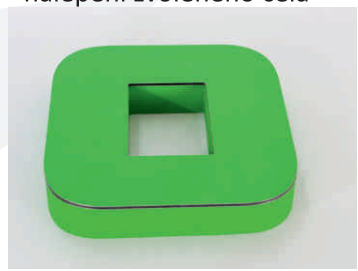
nalepení zvoleného čela